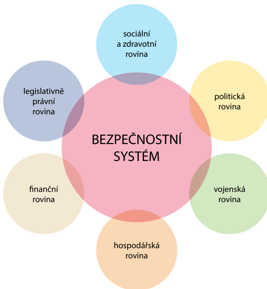
Obrázek 2 – Zajištění bezpečnostních zájmů obyvatel České republiky

Celý bezpečnostní systém je dán prolínáním řady rovin, jak je patrné z obrázku 2. Jejich stabilita zajišťuje jak jistotu z pohledu vnější, tak vnitřní bezpečnosti.