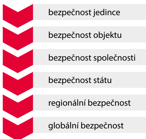
Obrázek 1 – Struktura bezpečnosti

Celý bezpečnostní systém je dán prolínáním řady rovin, jak je patrné z obrázku 2. Jejich stabilita zajišťuje jak jistotu z pohledu vnější, tak vnitřní bezpečnosti.